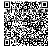
電子申請用 QR コード